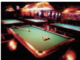
7F ビリヤード&ダーツバー