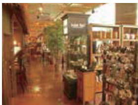
1F カフェ&バリ雑貨店