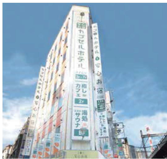
商業ビル一棟をカプセルホテルとして活用