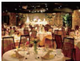
3~4F パーティスペース