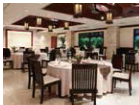
8F リゾートウェディング