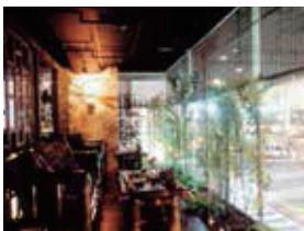
2F 多国籍ダイニング